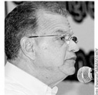
El gobernador dijo hace una semana que las críticas le entran por un oído y le salen por el otro.